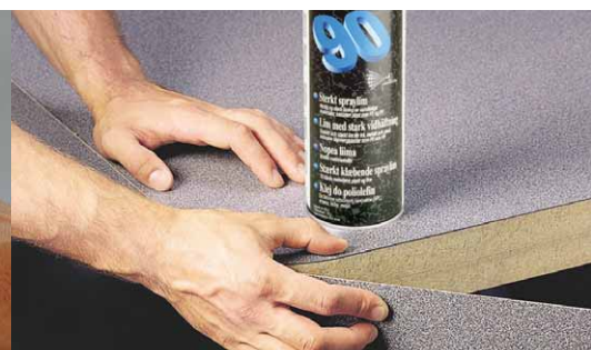
Fäst bänkskivelister med hjälp av Spray 90