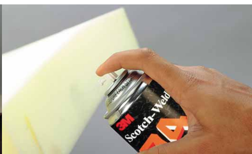
Använd Spray 74 för sammanfogning av skumplast