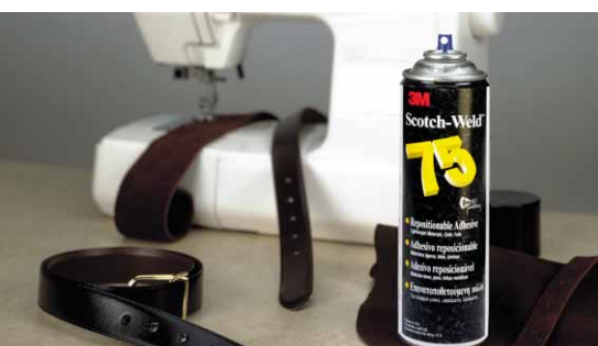
Håll emblem och märken på plats vid sömnad med hjälp av Spray 75

* Omflyttningsbart lim. ** Kontrollera beständighet mot mjukgörare.