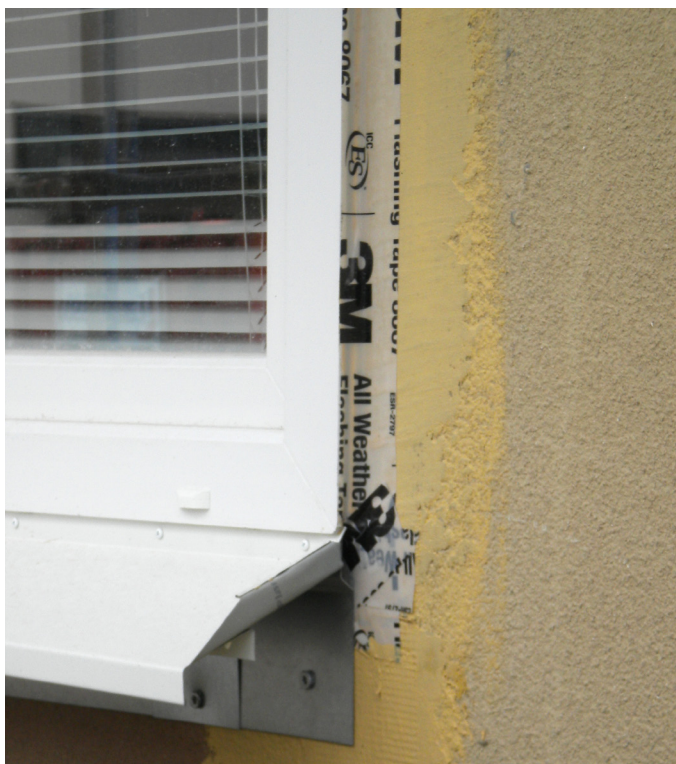
Utvändig lufttätning av fönster med 3M All Weather Flashing Tape 8067