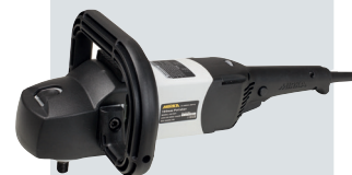
Mirka PS1524 Polermaskin