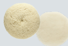
Flätad ull och Lammullshätta