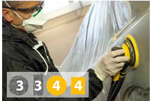
Slipning av grundning/filler

Ytterligare slipsteg kan behövas vid utsprutning.