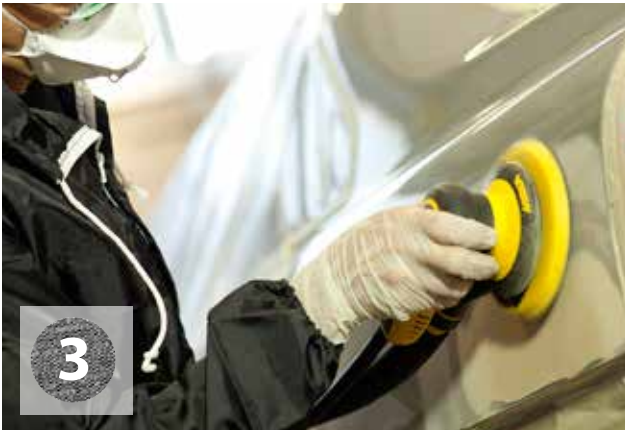
Slipning för slipgrund