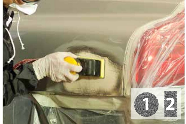
Riktning av spackel